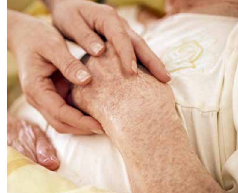
Die Fotos dieser Ausgabe sind, wenn nicht anders bezeichnet, von Werner Krüper .